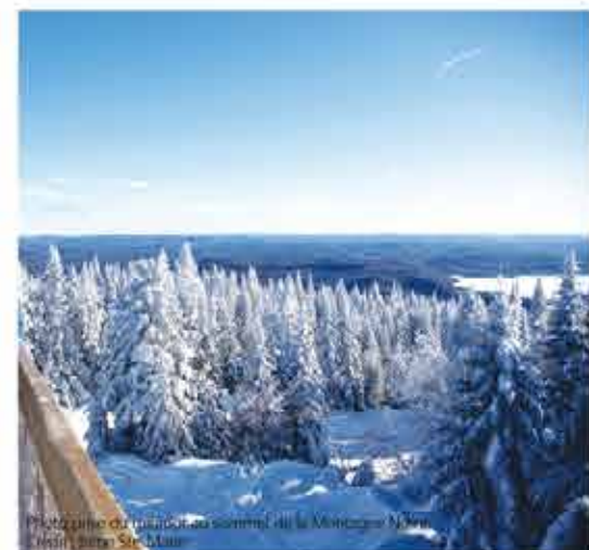
Photographie du mirador au sommet de la Montagne Noire.

Partie intégrante du Sentier national en Matawinie, le secteur Mont Ouareau relie les lacs Ouareau et Archambault en passant par le lac Lemieux et le refuge Paul-Perreault. Le sommet culmine à une altitude de 685 mètres et offre un vaste panorama sur le lac Ouareau. Un autre point de vue permet d'admirer les lacs Long et des Îles.